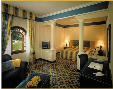
Dormire nel Castello del mito a due passi dal mare: Junior Suite