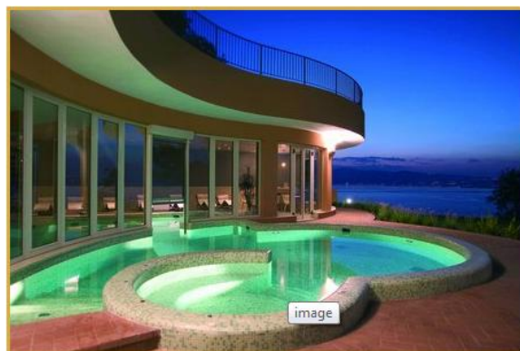
Centro benessere Notos

Kiwanis is a global organization of volunteers dedicated to