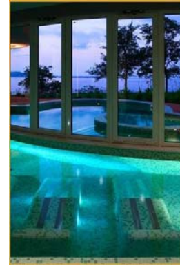
Centro Benessere Notos Interni