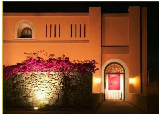
Il Castello del Mito

Kiwanis is a global organization of volunteers dedicated to