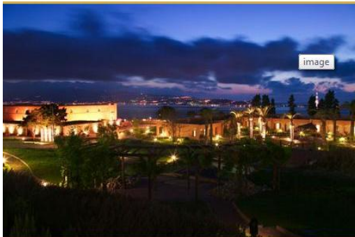
Altafiumara Hotel, il primo resort di lusso della Costa Viola

Altafiumara Hotel sorge nello splendido scenario naturale della Costa Viola nel tratto tra Villa San Giovanni e Scilla, a soli 11 Km da Reggio Calabria. E' immerso in un magnifico Parco di 10 ettari a picco sul mare, dove gli Ospiti possono scegliere di passeggiare in un'area "arredata" con sculture di artisti contemporanei, o all'interno dell'orto biologico oppure lungo la cosiddetta "passeggiata delle erbe aromatiche".