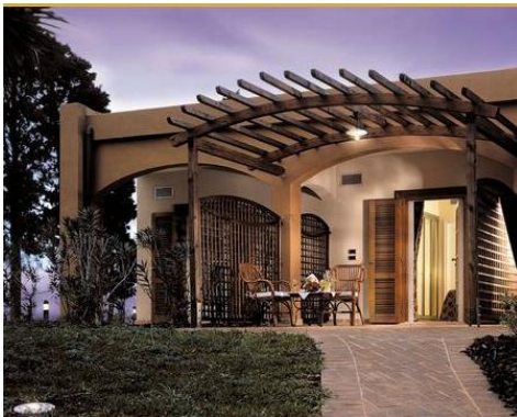
Le Isole: il patio