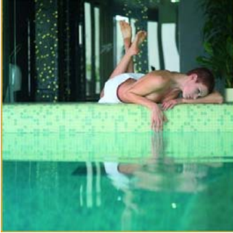
Centro Benessere Notos Interni