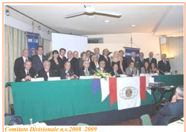
Comitato Divisionale a.s.2008_2009