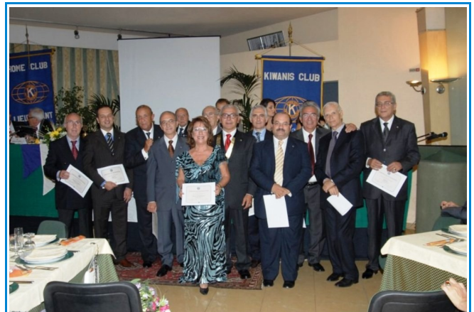
Direttivo a.s. 2009_2010