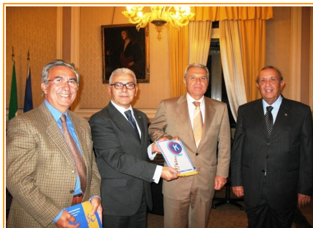
Visita al Prefetto di Catania, Dott. V. Santoro