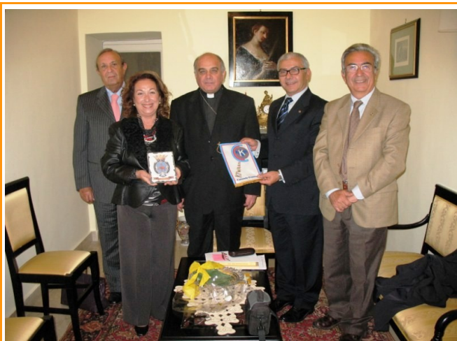
Visita a Mons. Gristina, Arcivescovo di Catania