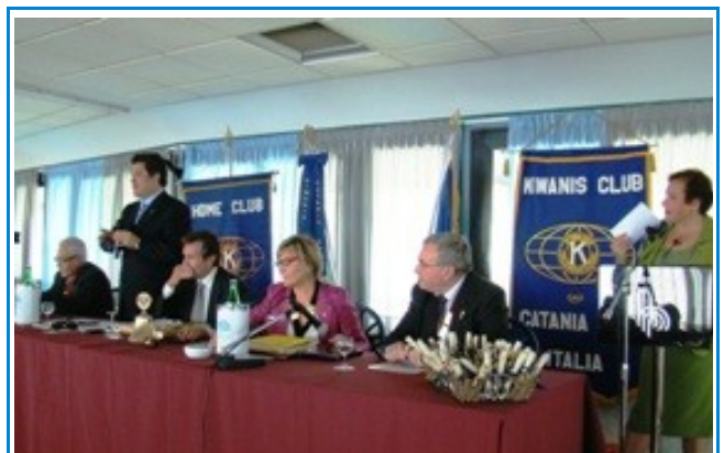
Intervento del Presidente della Federazione Europea, Gianfilippo Muscianisi