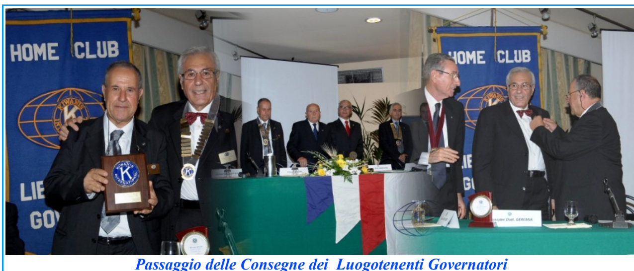
Passaggio delle Consegne dei Luogotenenti Governatori