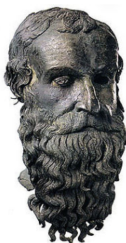
La Testa del Filosofo Museo Nazionale della Magna Grecia Reggio Calabria

I costi della manifestazione (da intendersi a persona) sono riportati nella tabella sottostante, secondo le varie opzioni disponibili.