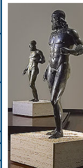
I Bronzi di Riace Museo Nazionale della Magna Grecia Reggio Calabria