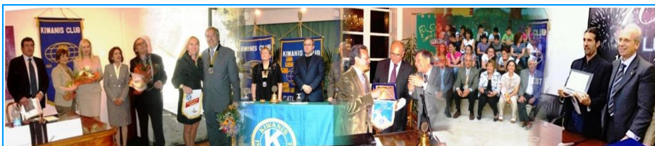
Panoramica di alcune attività significative dei vari Club